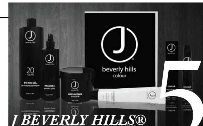
J BEVERLY HILLS® COLOUR™

Из года в год, изучая биологическую жизнь кожи и все внутренние и внешние факторы, ответственные за её функционирование, Арьеж (Auriege) совершенствует формулы составляющих своих продуктов и предлагает широчайший спектр косметических средств по уходу за кожей лица и тела для людей всех возрастных категорий с учетом типа кожи, времен года, состояний кожи в определенные моменты жизни. Выпускается как для домашнего, так и профессионального использования.