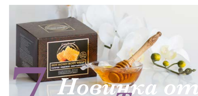
7 Новинка от Тимекс

J BEVERLY HILLS® COLOUR™ - мультивалентный краситель, предоставляющий возможность использования каждого тюбика краски, как перманентное, полуперманентное или оттеночное окрашивание. Другими словами, это краситель одной линии, которые дает прозрачный, плотный или матовый оттенок из одного тюбика. J BEVERLY HILLS® COLOUR™ - это 94 оттенка, прекрасно смешиваемых между собой и содержащих коктейль из натурально полученных растительных экстрактов: