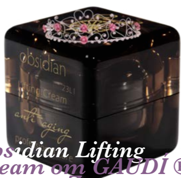
Obsidian Lifting Cream от GAUDI® LuxestarZ

Обеспечивает мгновенный видимый и пролонгированный терапевтический лифтинг. Содержит экстракт драгоценного минерала гематита, низкомолекулярный кремниевый комплекс и запатентованный пептид Syn-Husan®. При применении курсом от 14 дней восстанавливает здоровый цвет лица, уменьшает пигментацию, снимает отеки, предупреждает провисание кожи. Является неинвазивным филлером: заполняет морщины и возвращает лицу потерянный объем.