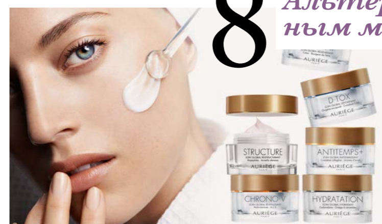
Альтернатива инъекционным методикам от Auriege

Из года в год, изучая биологическую жизнь кожи и все внутренние и внешние факторы, ответственные за её функционирование, Арьеж (Auriege) совершенствует формулы составляющих своих продуктов и предлагает широчайший спектр косметических средств по уходу за кожей лица и тела для людей всех возрастных категорий с учетом типа кожи, времен года, состояний кожи в определенные моменты жизни. Выпускается как для домашнего, так и профессионального использования.