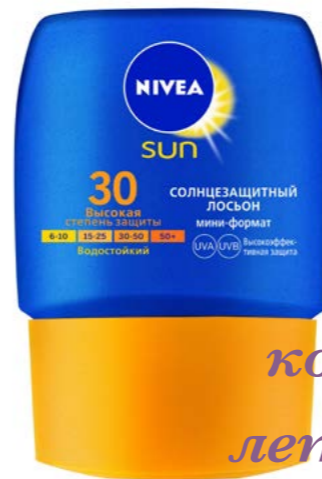
4 NIVEA Sun: компактное решение в летнее время

В летнюю жару не всем удастся сбежать на море и придется дожидаться отпуска в раскаленной городской среде. В мегаполисе открытые участки тела находятся под прямыми солнечными лучами едва ли не больше, чем на пляже. Специально для защиты кожи в таких условиях NIVEA SUN, бренд №1 в мире по защите от солнца, выпускает новинку – Солнцезащитный мини-лосьон «Защита и увлажнение» SPF 30.