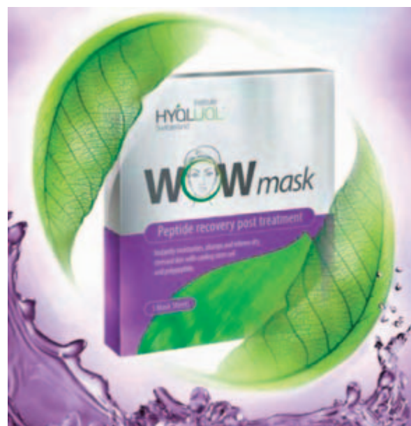
Рис. 1. Hyalual® WOW mask — гидрогелевая пептидная маска с RMCР-комплексом для профессионального использования

Официальный представитель ТМ Hyalual в России: ООО «РедермаСвисс» Тел.: +7 (495) 713-91-22 www.hyalual.ru